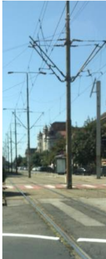
Stâlpi vopsiți și corodați