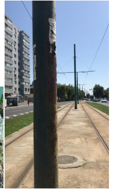
Calea Șagului intersecție cu Bulevardul Ana Ipătescu