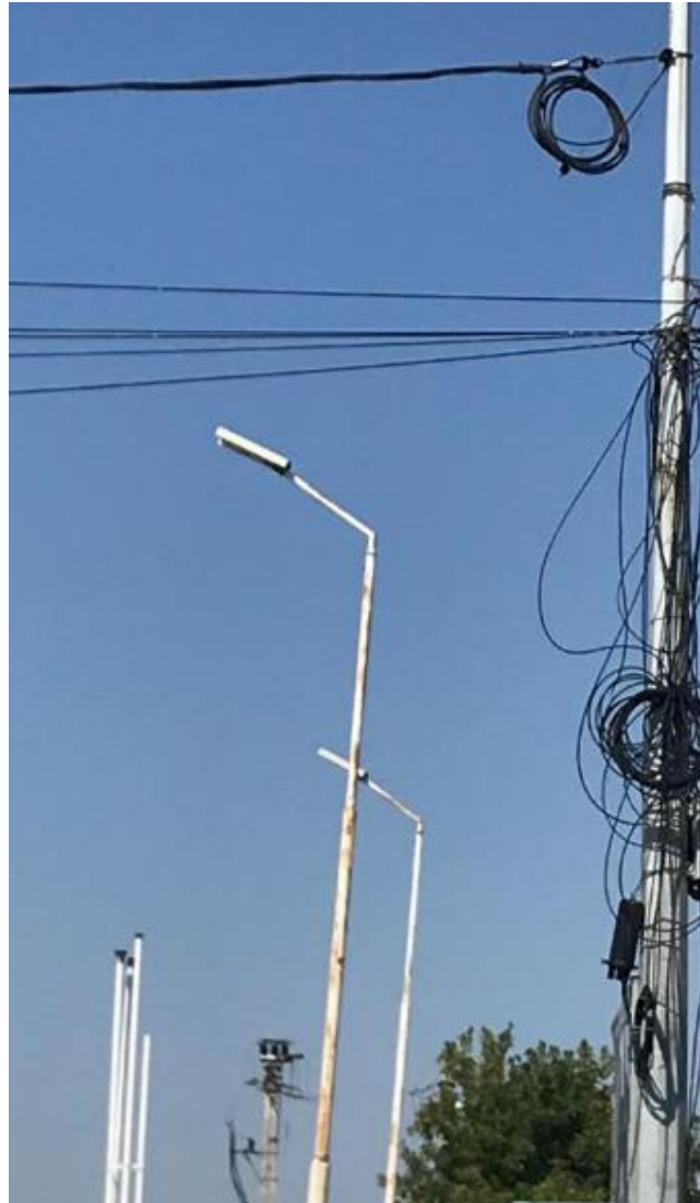
Stâlp vopsit corodat (centrul imaginii) Stâlp zincat termic (dreapta imaginii)

Vechi și nou Se impune atenție la investiții care pot fi generatoare de costuri și riscuri tehnice (a se vedea GP 035 - 98 care stabilește cum se urmărește comportarea acoperirilor anticorozive)/investiții sustenabile