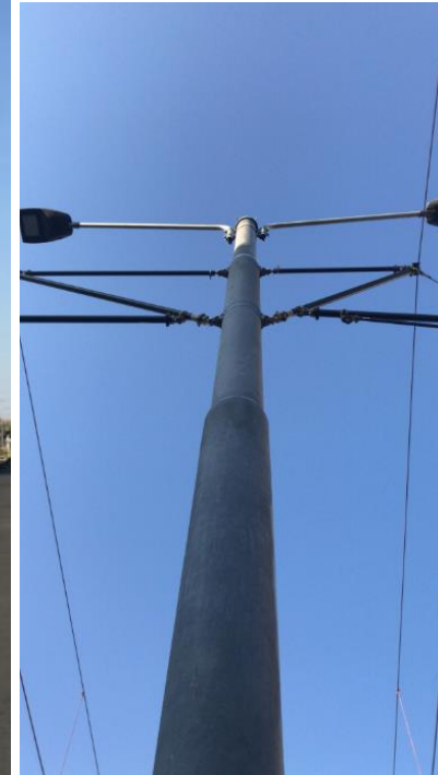
Stâlpi zinați termic