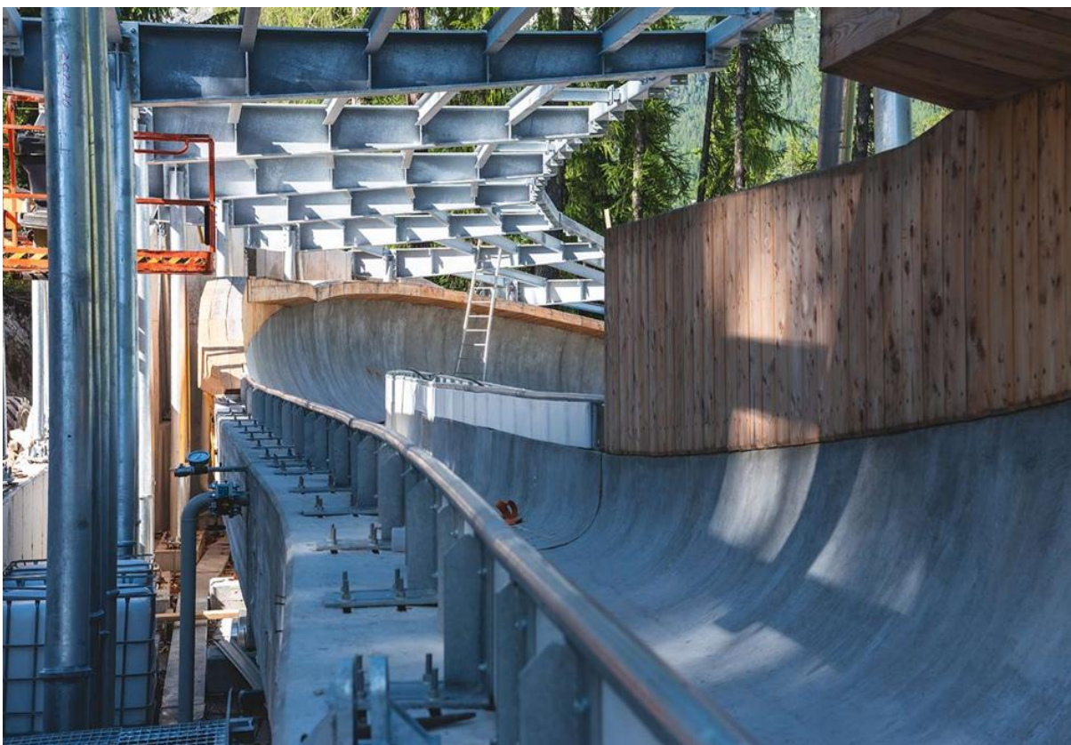
Structura metalică a pistei în timpul construcției – se observă elementele de oțel zincat termic (aspect gri-argintiu) ce susțin canalul de beton al pistei.

Un element esențial al durabilității pistei din Cortina îl constituie protecția anticorozivă a structurilor de oțel prin zincare termică. Întreaga structură metalică – de la grinzi și stâlpi până la elementele de copertină și acoperiș ale pistei – a fost protejată prin imersie în baie de zinc topit , asigurându-se acoperirea fiecărei piese cu un strat uniform de zinc. Firma specializată care a realizat procesul subliniază că, la o infrastructură expusă intemperiiilor și solicitărilor intense, protejarea oțelului este o prioritate absolută . Experiența îndelungată în zincarea termică componentelor structurale de mari dimensiuni a permis obținerea unei protecții de înaltă calitate și precizie, utilizând una dintre cele mai mari instalații de zincare din Europa. Rezultatul este o structură rezistentă la coroziune pe termen lung, chiar și în climatul dificil al iernilor alpine.