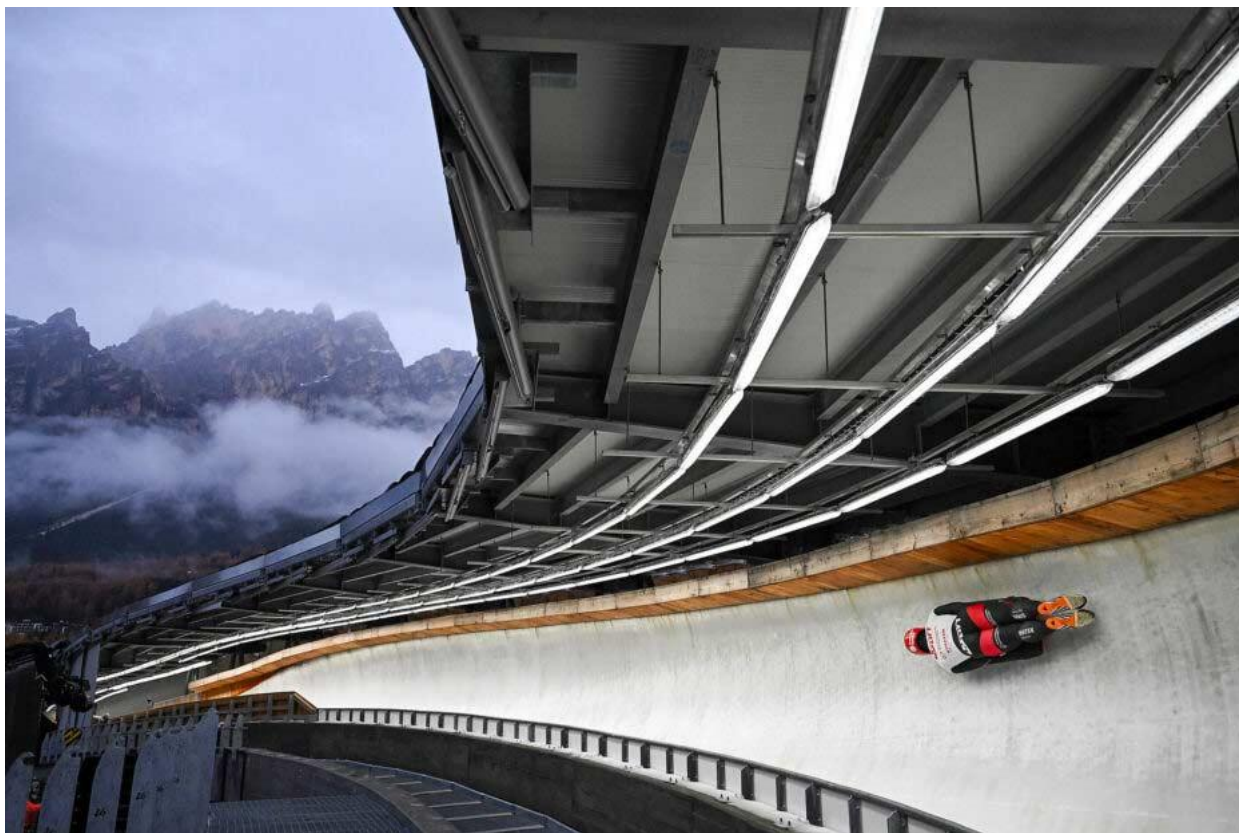
Pista olimpică „Eugenio Monti” din Cortina d’Ampezzo, reconstruită pentru Jocurile din 2026, îmbină structura de oțel (ascunsă sub canalul de gheață) cu elemente de integrare protejat anticoroziv prin zincare termică în peisajul montan.

De la concepție până la execuție, Cortina Sliding Centre demonstrează un echilibru între exigențele sportive și cele de durabilitate . Structura din oțel zincat termic a avut un rol cheie în atingerea acestui deziderat, oferind atât siguranță structurală pe termen lung, cât și performanțe la standard olimpic în condiții extreme. Alături de măsurile de protecție a oțelului, proiectul a inclus și alte soluții sustenabile: integrarea vizuală în mediul natural (de exemplu, acoperișuri parțial verzi și refacerea vegetației după construcție) și tehnologii ecologice precum sistemul frigorific pe bază de glicol, care minimizează riscul de poluare chimică. Toate aceste elemente contribuie la un legado pe termen lung – centrul de bob va rămâne o infrastructură de referință, eficientă și cu întreținere redusă, pregătită să deservească competiții și antrenamente mulți ani după încheierea Jocurilor Olimpice din 2026.